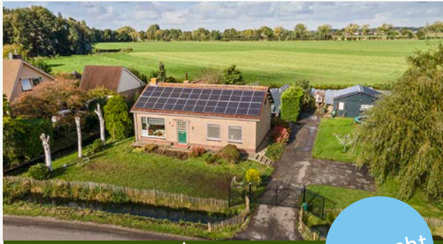
Lage Giessen 30 | Hoornaar

Woonoppervlakte: 236 m 2 Perceeloppervlakte: 320 m 2