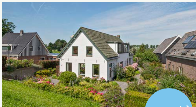
Lingedijk 191 | Oosterwijk

Woonoppervlakte: 202 m 2 Perceeloppervlakte: 3.535 m 2