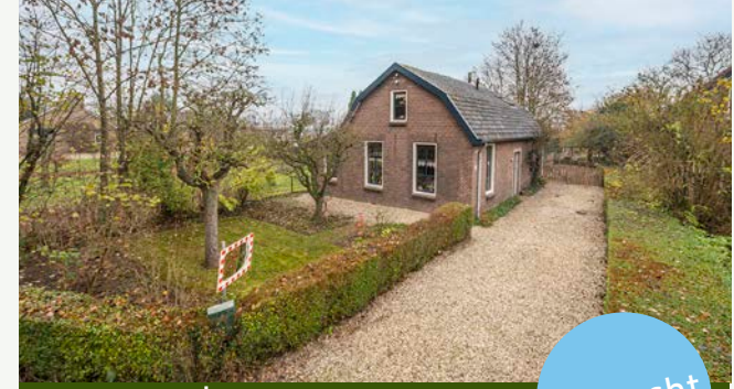
Uiterdijk 3 | Geldermalsen

Woonoppervlakte: 109 m 2 Perceeloppervlakte: 2.251 m 2