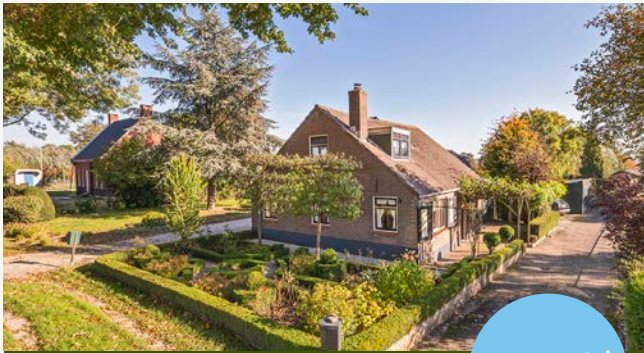
Lakerveld 154 | Lexmond

Woonoppervlakte: 92 m 2 Perceeloppervlakte: 410 m 2