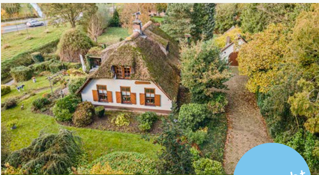
Kaalakkerstraat 1 | Waardenburg