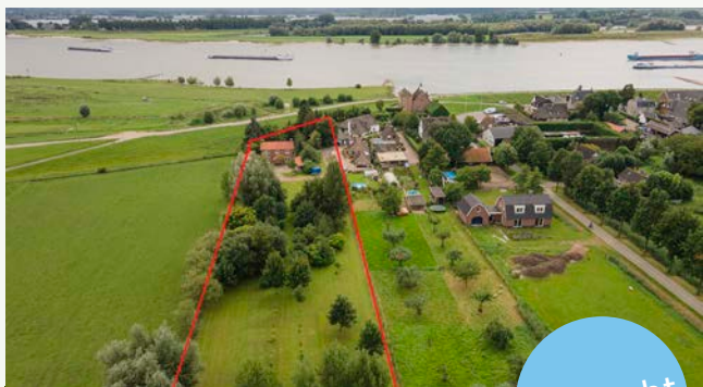
Waalbandijk 65 | Hellouw

Woonoppervlakte: 229 m 2 Perceeloppervlakte: 1.375 m 2