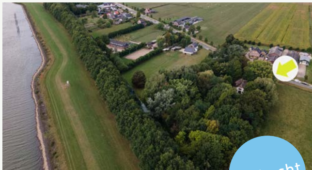
De Heuvel 50 | Rijswijk (Gld)

Woonoppervlakte: 219 m 2 Perceeloppervlakte: 10.420 m 2