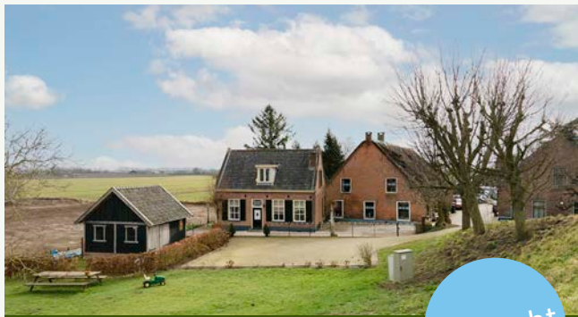
Lekdijk 28 | Tienhoven aan de Leeg

Woonoppervlakte: 177 m 2 Perceeloppervlakte: 1.002 m 2