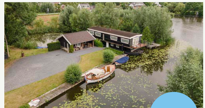
Lingedijk 1a | Asperen

Woonoppervlakte: 172 m 2 Perceeloppervlakte: 3.525 m 2