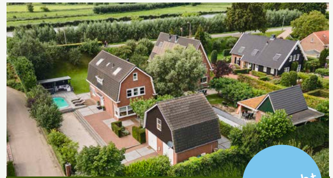
Prins Clausstraat 1 | Leerdam

Woonoppervlakte: 109 m 2 Perceeloppervlakte: 1.355 m 2