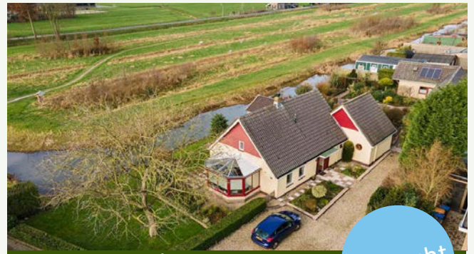
Tiendweg 170 | Leerdam

Woonoppervlakte: 175 m 2 Perceeloppervlakte: 1.290 m 2