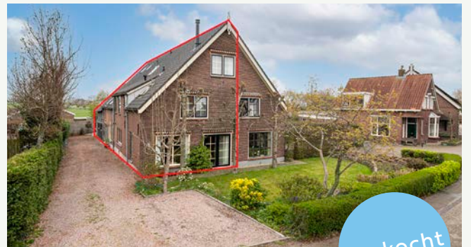
Dorpsweg 36 | Hoornaar

Woonoppervlakte: 270 m 2 Perceeloppervlakte: 689 m 2