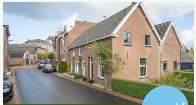
Noordzijde 28 | Noordeloos

Woonoppervlakte: 157 m 2 Perceeloppervlakte: 2.399 m 2