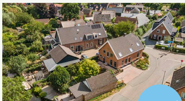
Dorpsweg 27 | Hoornaar

Woonoppervlakte: 195 m 2 Perceeloppervlakte: 515 m 2