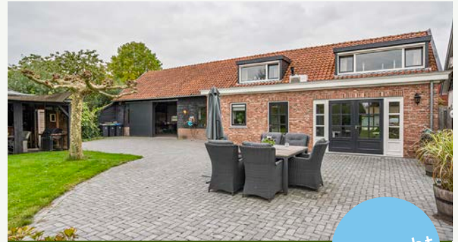
Achterweg 22 | Rump

Woonoppervlakte: 122 m 2 Perceeloppervlakte: 655 m 2