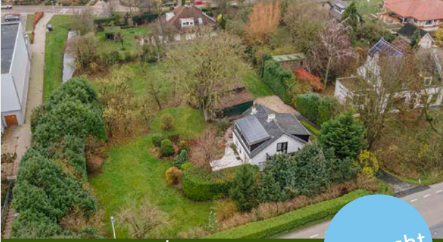
Schoolstraat 12 | Arkel

Woonoppervlakte: 155 m 2 Perceeloppervlakte: 2.775 m 2