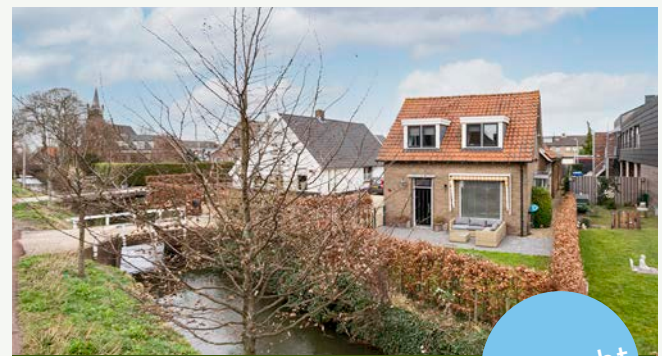
Dorpsweg 19 | Zijderveld

Woonoppervlakte: 140 m 2 Perceeloppervlakte: 5.860 m 2