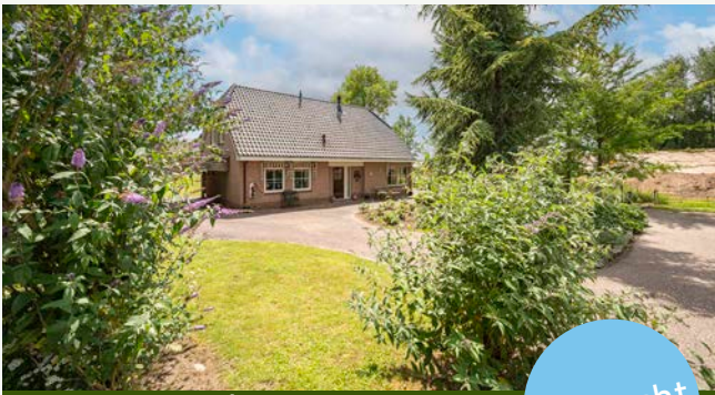
Waaldijk 14b | Herwijnen

Woonoppervlakte: 170 m 2 Perceeloppervlakte: 4.280 m 2