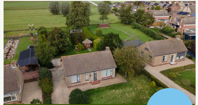
Zijkade 12 | Nieuwland

Woonoppervlakte: 73 m 2 Perceeloppervlakte: 1.880 m 2