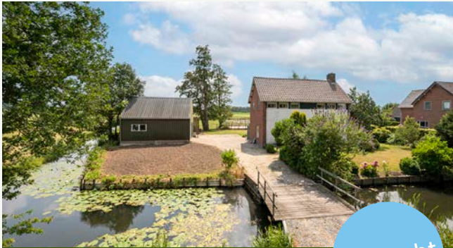
Achterdijk 21 | Nieuwland

Woonoppervlakte: 107 m 2 Perceeloppervlakte: 1.180 m 2