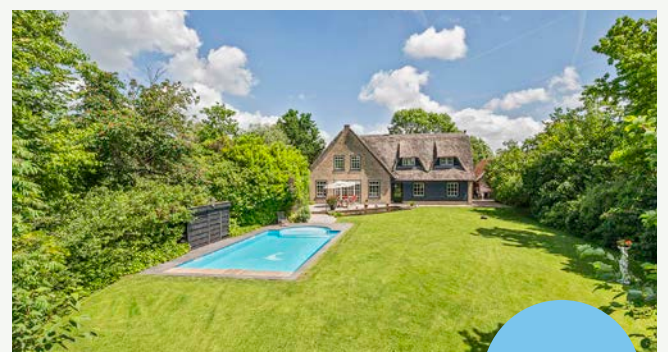
Groeneweg 7 | Hoogblokland

Woonoppervlakte: 410 m 2 Perceeloppervlakte: 4.325 m 2