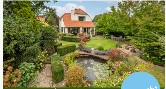
Slotstraat 56 | Beesd

Woonoppervlakte: 98 m 2 Perceeloppervlakte: 1.610 m 2